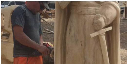
изготовление деревянных скульптур