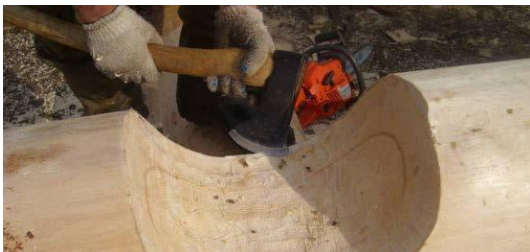
выравнивание чаши сруба