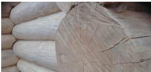
шлифовка торцов и бревен сруба