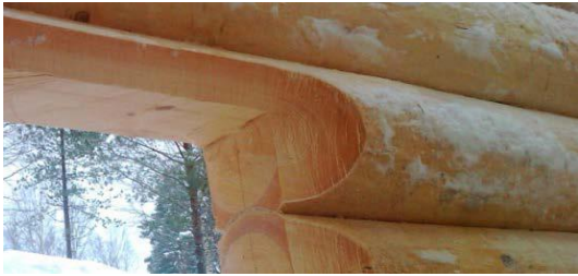
изготовление зальсок на бревнах