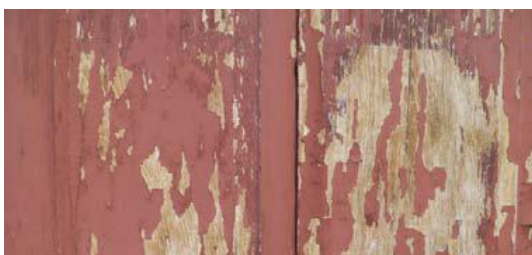
быстрое снятие старой краски