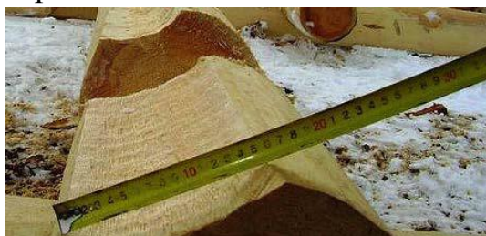
выравнивание межвенцовых пазов